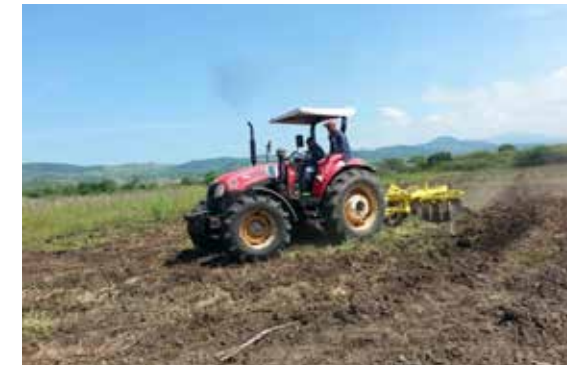
Preparación de tierra para la siembra de tabaco

Con el propósito de producir capa dominicana de buena calidad y reducir las importaciones de este. El Intabaco mantiene este programa en sus estaciones experimentales y ofrece servicios de asesoría a las empresas del sector privado que incursionan en esta actividad. Los resultados han sido muy buenos y se continúa trabajando en la obtención de variedades con características caperas.