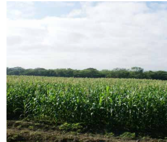
Producción de maíz a través del programa de rotación de cultivos.

A través de esta dependencia de la Dirección Industrial, el Intabaco ofrece servicios a la industria del cigarro mediante la capacitación de personal que será empleado en esas empresas. Para lo cual se imparten cursos de "Elaboración de Cigarros" a jóvenes generalmente hijos de productores tabacaleros, los cuales se insertan en el mercado laboral y ayudan en el sustento de sus familias.