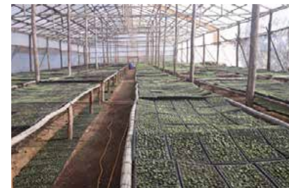
Producción de plántulas de tabaco en ambiente controlado