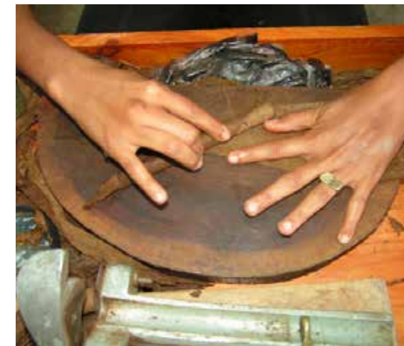
Elaboración de cigarros hechos a mano en la Fábrica escuela.