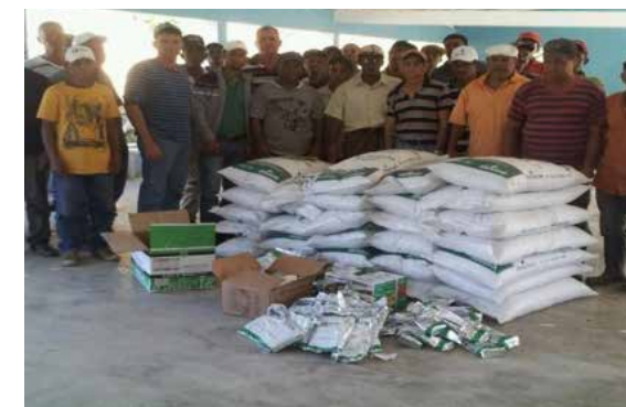
Entrega de insumos agrícolas a productores tabacaleros